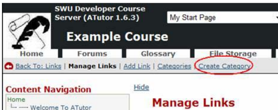
รูปที่ 2.13.2 เมนูการสร้างหมวดหมู่แหล่งวิทยากรรายวิชา

เมื่อคลิกที่ Create Category แล้วจะปรากฏดังรูปด้านล่าง ให้ User ใส่ชื่อ Category ที่ Title แล้วคลิกที่ปุ่ม Save เพื่อสร้าง Category