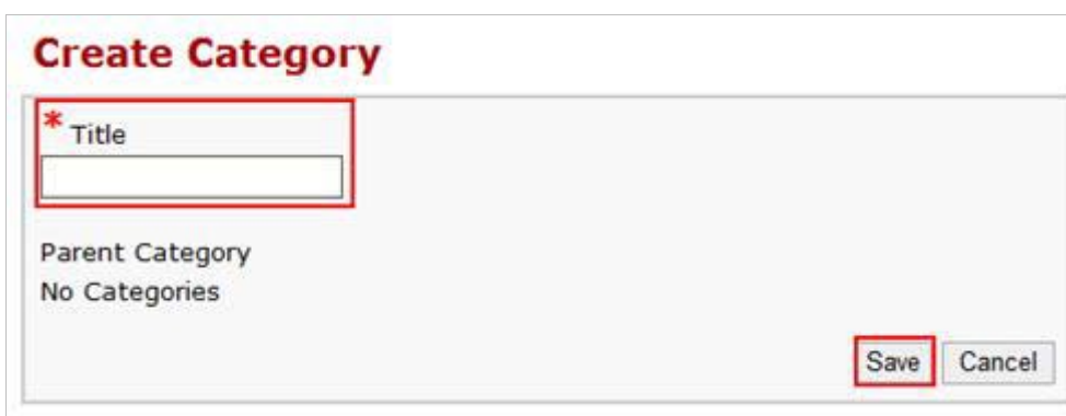
รูปที่ 2.13.3 การสร้างหมวดหมู่แหล่งวิทยากรรายวิชา

เมื่อคลิกที่ Create Category แล้วจะปรากฏดังรูปด้านล่าง ให้ User ใส่ชื่อ Category ที่ Title แล้วคลิกที่ปุ่ม Save เพื่อสร้าง Category