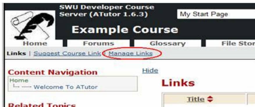
รูปที่ 2.13.1 เมนูการสร้างแหล่งวิทยากรรายวิชา

วิธีการสร้างลิงค์ทำได้โดยคลิกที่ Manage Links